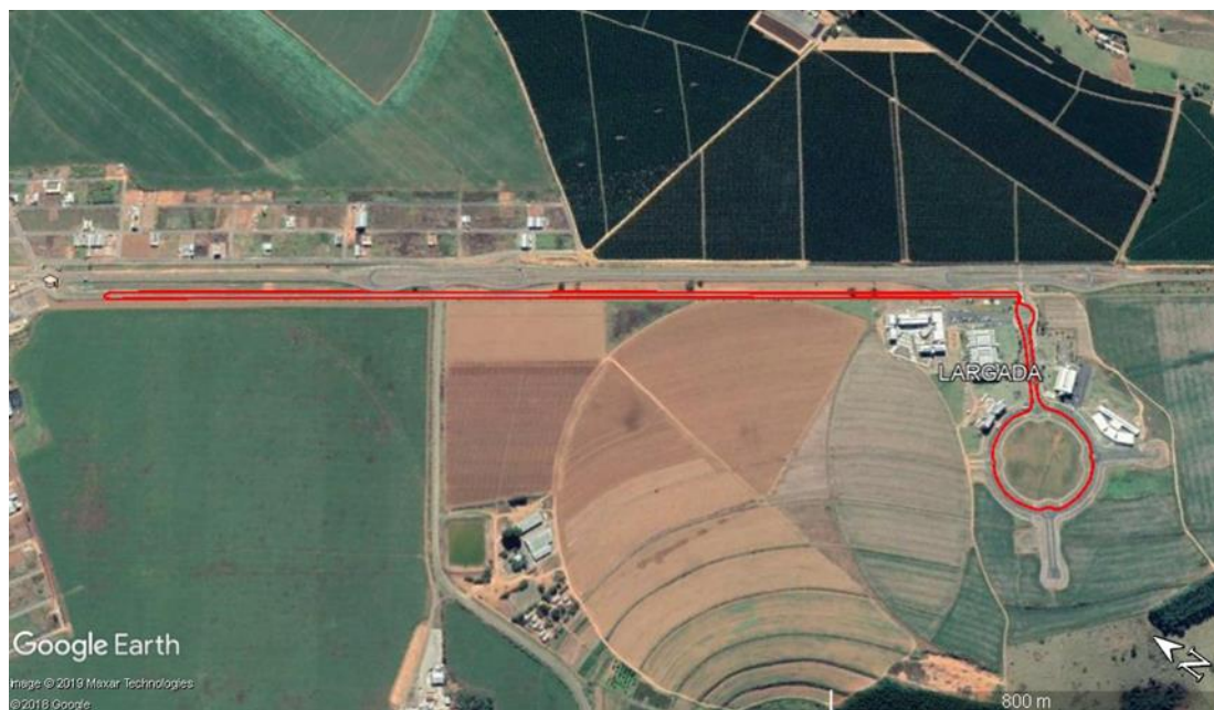
Figura 01 – Imagem do Campus da UFV/CRP com trajeto da corrida.